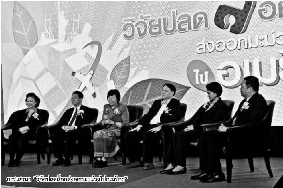
การเสวนา "วิจัยปลดล็อกส่งออกมะม่วงไปอเมริกา"

หัวข้อข่าว: วิจัย'มะม่วงไทย'โกอินเตอร์ ปลดล็อก'น้ำดอกไม้อีสทอง'สู่อเมริกา